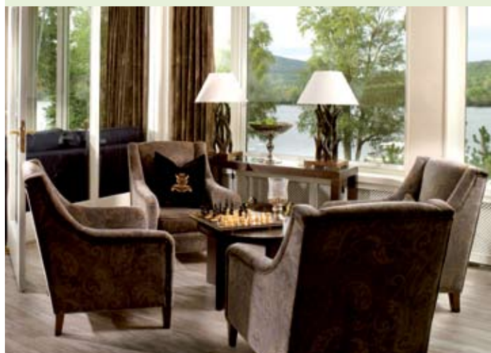
NYOPPUSSET: Brudeparet fikk seg en positivt overraskelse mellom bestilling og avvikling av bryllupet - hotellet er nemlig nyoppusset!